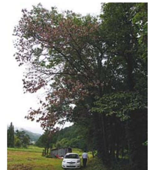
ナラ枯れになった被害木