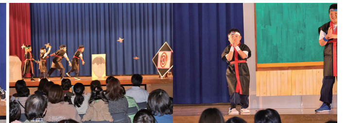
おおそら・つばさ学級 劇「忍者学校 おおさわぎ」