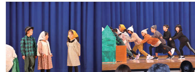
1年生 劇「おおきななぐ」