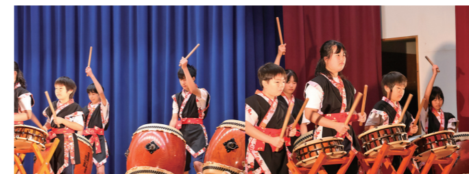
5・6年生 和太鼓「山神」