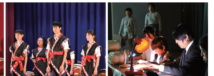
6年生 おわりの言葉