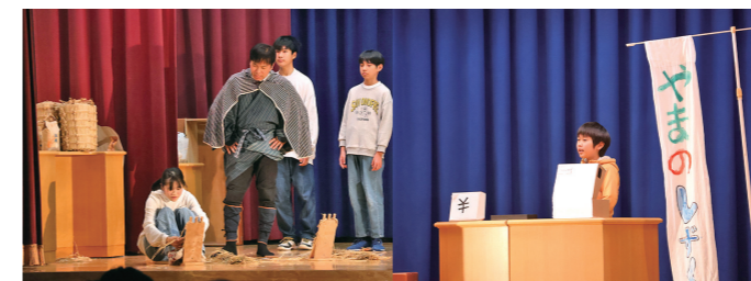
5・6年生 劇「タイムトラベルin七ヶ宿町」