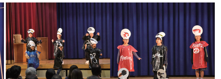
2年生 劇「おたまじゃくしの101ちゃん」