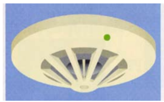
熱を感知する警報器(熱感知器) 調理の煙や湯気による誤発報が心配される台所に設置します