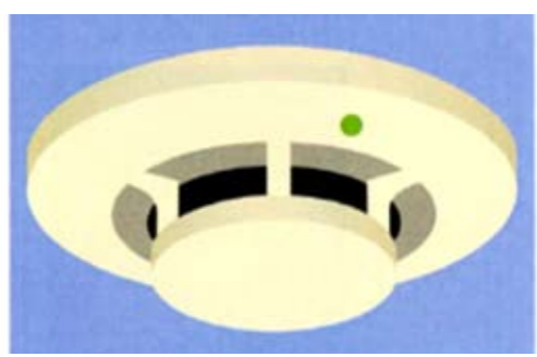
煙を感知する警報器(煙感知器) 寝室・階段・台所等に設置します

住宅火災による死者の割合が高いことから、平成23年6月1日から全国の市町村で住宅用火災警報器の設置が義務付けられます。 宮城県では、全国に先がけ平成20年6月1日から設置が義務となっています。県全体の設置率は78.7%、七ヶ宿町では87.2%まで普及していますが、基準通りに設置している家庭は少ないようです。 住宅用火災警報器は、全ての寝室、台所、階段(2階に寝室がある場合)に設置しなければなりません。 住宅火災から大切な家族の命を守るため、住宅用火災警報器を設置しましょう。