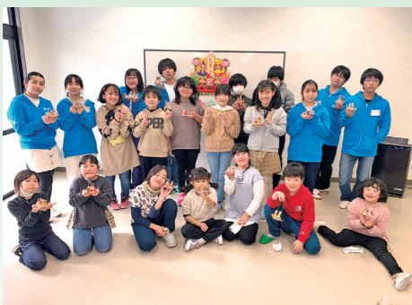
▲かわいらしい作品が完成♪

ジュニア・リーダーと遊ぼう冬 2月26日、小学生を対象にジュニア・リーダーと遊ぼうを開催し、工作やレクリエーションを行いました。工作では、季節の飾りとして、木のおひなさまと、折り紙でウサギだるまを作りました。ジュニア・リーダーの中学・高校生に手伝ってもらいながら、細かい作業も行うことができました。レクリエーションでは、ジュニア・リーダーが研修会で学んだゲームを紹介・実践し、体を動かしながら遊びました。会場には元気の歓声が響いていました。今回制作した作品は、水と歴史の館春の特別展で展示されています。