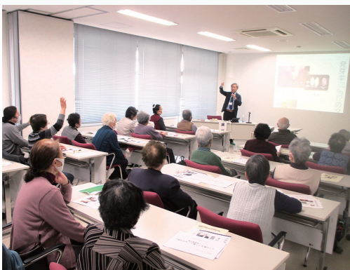
▲暮らしに使える知識を学習

ジュニア・リーダーと遊ぼう冬 2月26日、小学生を対象にジュニア・リーダーと遊ぼうを開催し、工作やレクリエーションを行いました。工作では、季節の飾りとして、木のおひなさまと、折り紙でウサギだるまを作りました。ジュニア・リーダーの中学・高校生に手伝ってもらいながら、細かい作業も行うことができました。レクリエーションでは、ジュニア・リーダーが研修会で学んだゲームを紹介・実践し、体を動かしながら遊びました。会場には元気の歓声が響いていました。今回制作した作品は、水と歴史の館春の特別展で展示されています。