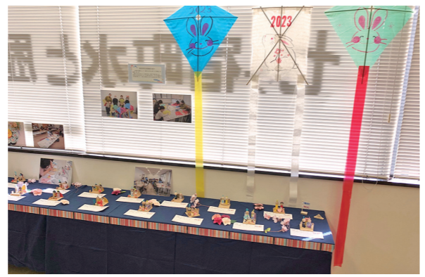
▲個性豊かな作品が並んでいます