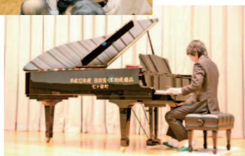
総務課羽隅主事によるピアノ演奏