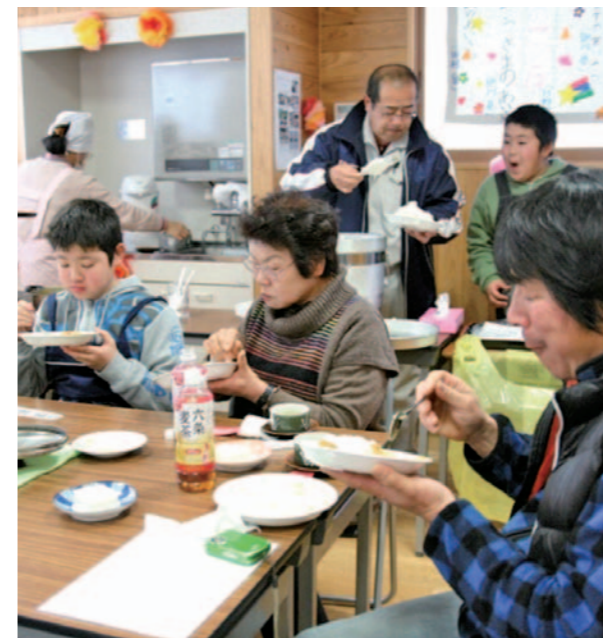
お米もカレーも大人気。おかわりはみんな大盛りでした