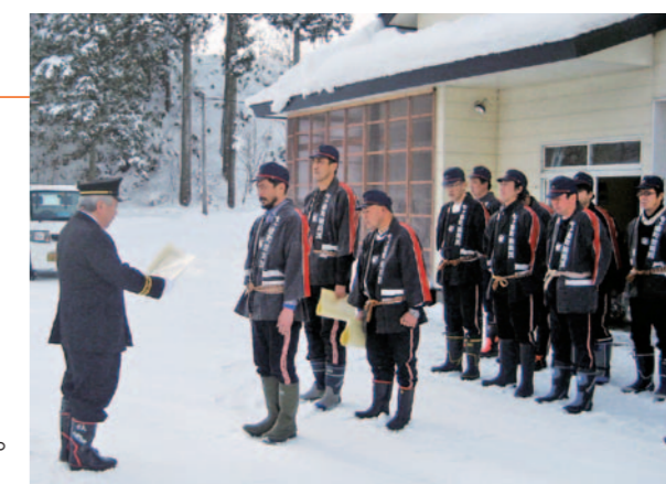
宮城県消防協会表彰状伝達の様子（峠田）

また、各地区の消防団員が各世帯を訪問し、火の用心のお札を配って一年の無火災を呼びかけました。