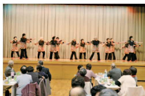
七ヶ宿町レクダンスクラブによるダンスの披露

1月22日、活性化センターで豊齢者大学、七ヶ宿町老人クラブ連合会の新年会が開催されました。当日は約80名の方々が参加し、様々なアトラクションを楽しみました。