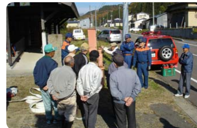
▲地区ぐるみ講座で防火教室を行いました（干蒲地区）