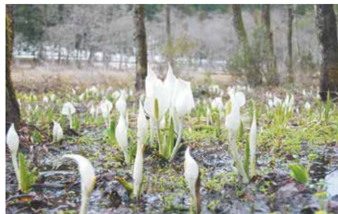
4月下旬に見頃を迎えました