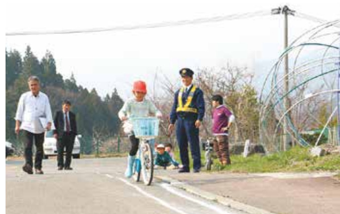
坂道はブレーキをかけながらゆっくりと