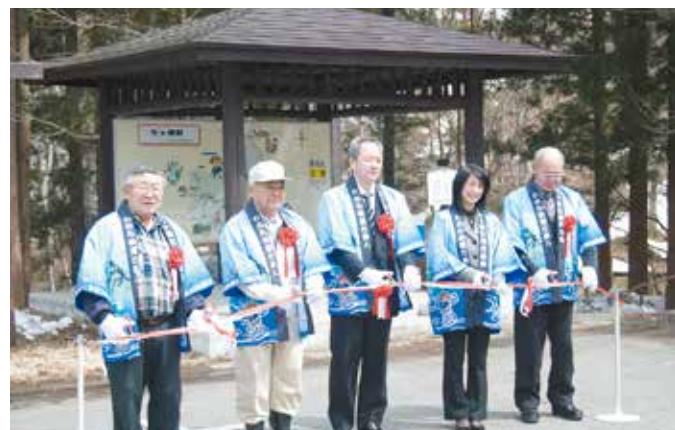
テープカットのようす

4月10日に「水芭蕉群生地オープン式」が行われました。当日は観光協会をはじめ、関係者が集まり、オープン宣言を行い今年の水芭蕉の開花状況などを確認しました。開花したばかりの水芭蕉にお客様も訪れ、残雪の中の水芭蕉を楽しまれました。連休終了頃まではおばちゃん漬けや玉こんなど販売も行われています。