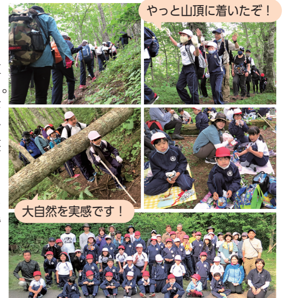
やっと山頂に着いたぞ！

雨で延期した全校登山。6月8日は、天候に恵まれコンディションの良い状況での登山実施となりました。蛤山の登山道はなかなかの傾斜があるため、足場を探しながらゆっくりと登って行きました。休憩を取りながらとはいえ、ピークが過ぎたかと思うと次の傾斜があり、児童の多くは、くたくたになりながら登りました。特に低学年の児童は、言葉数が減り疲労が見られましたが、高学年の子供たちやボランティアの皆様へ励まされて、諦めずに歩き続けることができました。頂上に着いたときの子供たちの笑顔がとても素敵でした。下山も長い道のりでしたが、全員が同じコースを歩き通すことができ、達成感に満たされた1日となりました。事前下見のときからご指導いただいた登山ボランティアの皆様、当日児童の補助をしていただいた保護者ボランティアの皆様のおかげで無事に活動を終えることができましたことに感謝申し上げます。ありがとうございました。