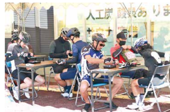
▲こ・らっしえで蕎麦が提供されました

9月25日、今年で4回目を迎える「グル麺ライド」が開催されました。「グル麺ライド」は2市2町(高畠町・南陽市・七ヶ宿町・白石市)のご当地麺を食べながら約100kmの道のりを自転車で走破するイベントです。七ヶ宿町ではこ・らっしえで蕎麦を提供したほか、休憩所の旬の市ではりんごが用意されました。参加された方々は七ヶ宿町の自然や景色、秋の味覚を満喫していました。