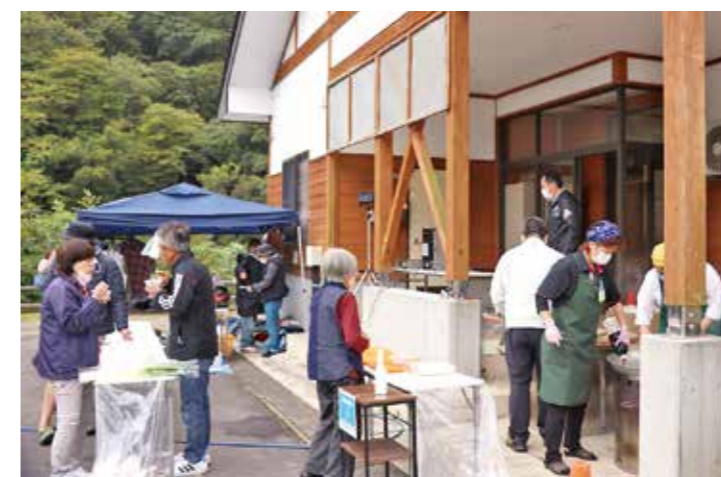
▲毎年好評のお振舞い

10月9日、道の駅七ヶ宿、旬の市七ヶ宿、せせらぎの里、ゆのはら農産直売所、こ・らっしえの5施設で秋の幸まつりが開催されました。当日は、旬の特産品や七ヶ宿ブランド品などが販売されたほか、それぞれの事業所の個性を生かした七ヶ宿の秋の味覚が来場者に無料で振る舞われました。複数の会場を回ることによって景品が当たるスタンプラリーも盛況で、様々な施設でスタンプを集める人たちの姿が見られました。