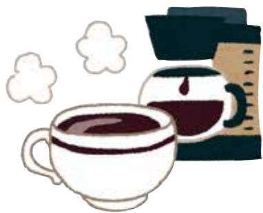
▲雪室珈琲を片手に交流しましょう