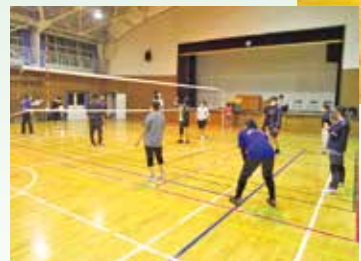
家庭バレーボール模 擬試合！

スポーツ体験会を開催して います。中学校体育館と峠田遊 林館を隔週で回り、家庭バ レーボール、ポッチャ、卓球 ポッチャと卓球バレーは、ま だまだ町内では馴染みのない スポーツですが、簡単なルー ルなので子供もすぐに覚えて プレイすることができました。 回を追うごとに参加者も増え、 体を動かしながら幅広い年代 が交流することができました。