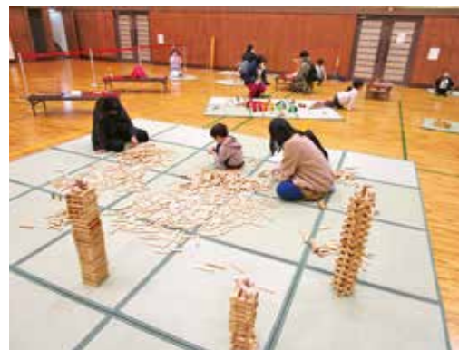
▲昨年度のオモチャ遊びのようす