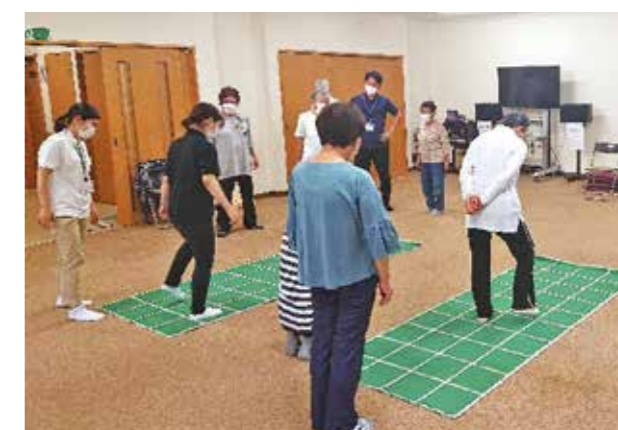
▲よいトレ:室内でスクエアステップ