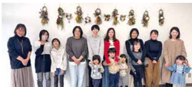
▲作品の前で記念撮影♪

12月21日に、女性講座「お正月飾りづくり」を開催しました。もりのわ工房さんを講師にお招きして、町内で採れた材料から好きな物を選び、しめ縄を飾り付けました。自然の恵みに感謝しながら1年を振り返り、新年への期待を込めて丁寧に作っていました。参加したお子さんも小さいサイズの飾り付けに挑戦していました。楽しく和やかな雰囲気の中、素敵な作品に仕上がりました。