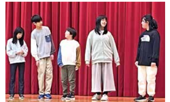
2080年から現代に戻りました

1月16日(木)に七ヶ宿町コミュニティスクール「みらい会議」が開催され、5・6年生が参加しました。この会議は、小中学生と地域の皆様が七ヶ宿町のよさを再確認し、七ヶ宿町のこれからのことを考えることで、小中学生の郷土愛を育むことを目的としています。当日は、日頃総合的な学習の時間などで学んだ内容を、小中学生が発表しました。5・6年生は、学習発表会の劇「タイムトラベルin七ヶ宿町」を披露し、2080年になっても、七ヶ宿町のよさや伝統が受け継がれ、町が活気付いている様子を伝えました。グループワークでは、小中学生と地域の皆様が一緒にグループになり、町のよさを生かすためにできることは何かをテーマに話し合いました。中学生が進行を務め、参加者から活発な意見発表がありました。5・6年生も、未来の七ヶ宿町を思い描きながら、意見を伝えることができました。地域の皆様の御協力もあり、小中学生の考えや視野が大きく広がる話し合いになりました。