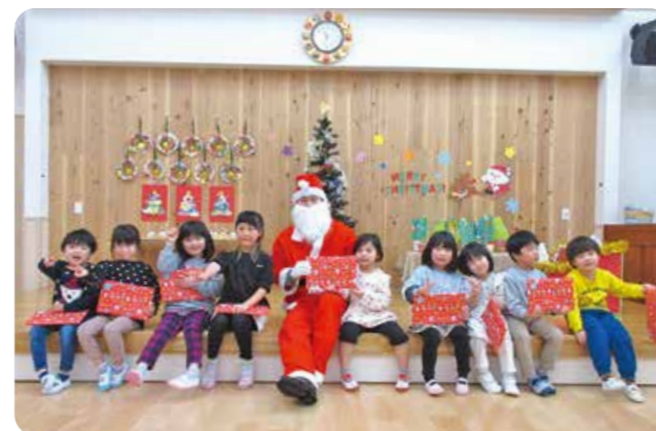
▲保育所にサンタさんがきました！

12月24日、関保育所でクリスマス会を行いました。12月に入り様々な場所でクリスマスの雰囲気を感じ、子どもたちは「サンタクロース」や「プレゼント」にわくわくしながらこの日を楽しみに過ごしていました。当日は、ツリーや子どもたちの製作物が飾られた遊戯室に鈴の音を鳴らしながらサンタクロースが登場。嬉しさと驚きでドキドキする中、プレゼントを受け取り、笑顔みせる子どもたちでした。