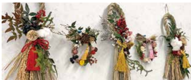
▲作品を鑑賞し合い、違いを楽しみました