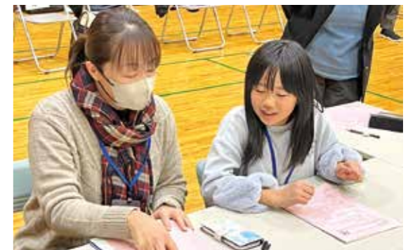
地域の方からたくさん学びました