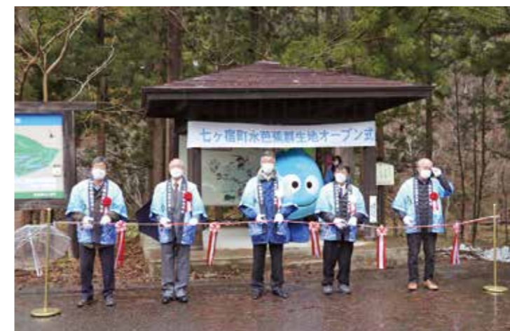
▲テープカットの様子

4月15日、玉ノ木原水芭蕉群生地に関係者など約20名が集まり、オープン式が開催されました。テープカットが行われたほか、オープン宣言を行い今年の水芭蕉の開花状況などを確認しました。今年は積雪量が多く水芭蕉の開花は1週間ほど遅れましたが、4月下旬には見頃を迎え、約3.5haの面積に咲いた約8万株の水芭蕉群が見る人を楽しませていました。