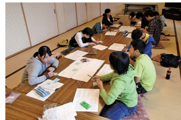
ジュニア・リーダーと遊ぼう