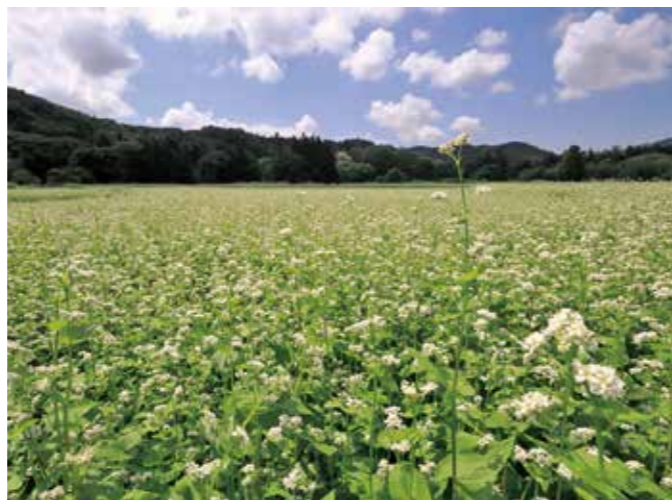
▲くらしんカフェ来訪者よりご提供いただいた写真(湯原地区そば畑)