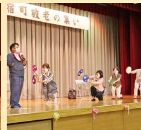
▲民政委員児童委員による寸劇