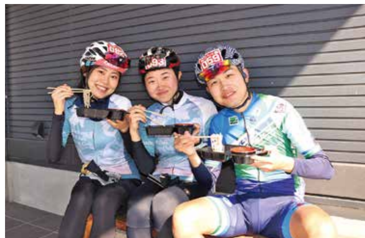
▲こ・らっしえで蕎麦が提供されました

9月24日、今年で5回目を迎える「グル麺ライド」が開催されました。「グル麺ライド」は2市2町(高畠町・南陽市・七ヶ宿町・白石市)のご当地麺を食べながら約100kmの道のりを自転車で走破するイベントです。七ヶ宿町ではこ・らっしえで蕎麦を提供したほか、休憩所の旬の市ではりんごが提供され、参加された方々は七ヶ宿町の自然や景色、秋の味覚を満喫していました。