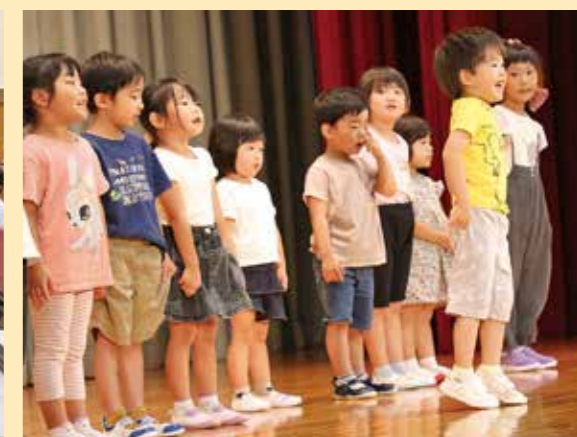
▲保育所園児の歌の発表