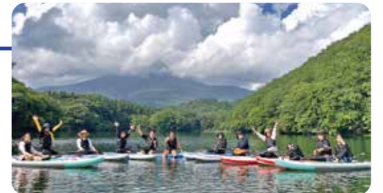
▲途中の雨も気にせず楽しみました

ベガルタハウス隣の畑で育ったジャガイモの収穫と長老湖でのアクティビティSUP体験が行われました。初めてSUP体験をする方も多かったのですが、わざと落ちたり落とされたり「またやりたい!」と大好評でした。