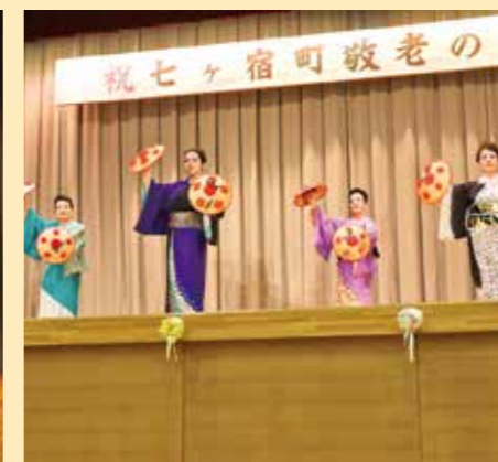
▲不二浪流ひまわり会による舞踊