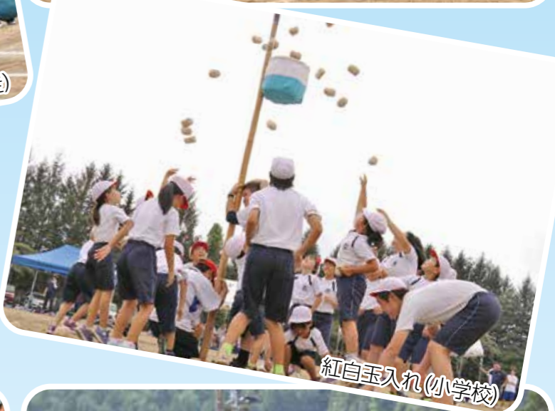
紅白玉入れ(小学校)