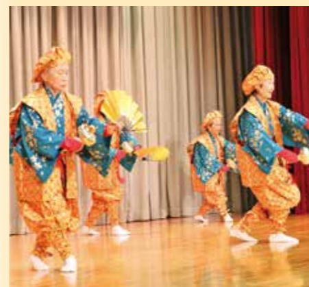
▲湯原大黒舞保存会による湯原大黒舞