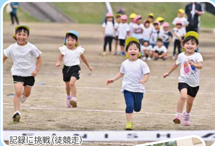
記録に挑戦(徒競走)