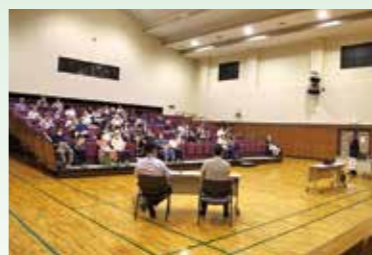
▲興味深く聞いていました