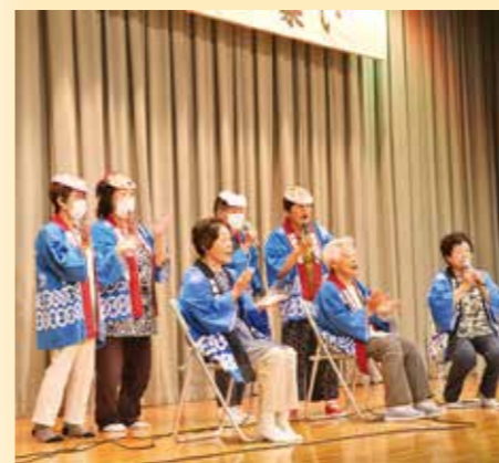
▲うたくりの会によるカラオケ