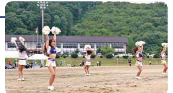
▲ベガルタチアリーダーズの皆さんありがとうございました

第51回七ヶ宿町民体育大会にベガルタチアリーダーズの方々が応援にかけつけてくれました。かっこいいパフォーマンスを見せてくれたり、七ヶ宿音頭と一緒に踊ってくれたりなど盛り上げてくれました。