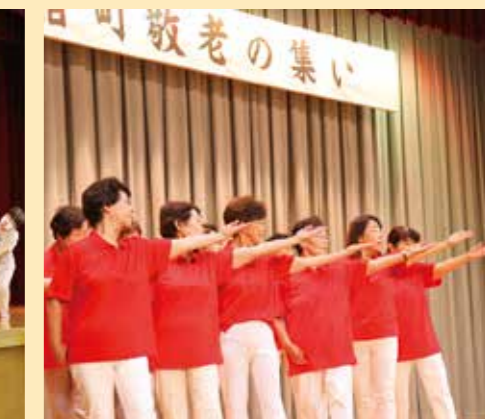
▲リズムダンスクラブによるダンス