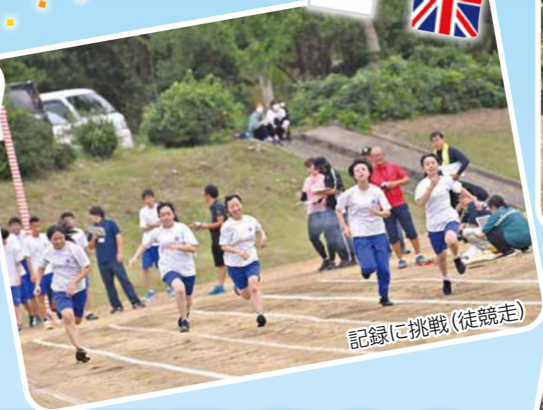
記録に挑戦(徒競走)