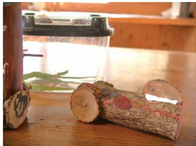
▲夏休み期間に行われた「薪わりペイント体験会」で制作したクラフト

特に暑い夏でした。熱中症・脱水症予防などの体調管理を普段以上に求められた気がします。七ヶ宿の夏は、ホテル・夏休み・お盆・そばの花、とあつという間に通過して季節は秋。七ヶ宿くらし研究所では実りの秋に向けて稲刈り体験・炊き込みごはん体験・紅葉体験など予定しています。体験会は町民価格を設けるなど利用しやすい仕組みを用意していますので、どうぞお気軽にご参加ください。