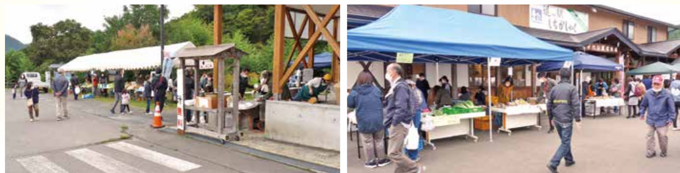
▲毎年大好評のお振舞い