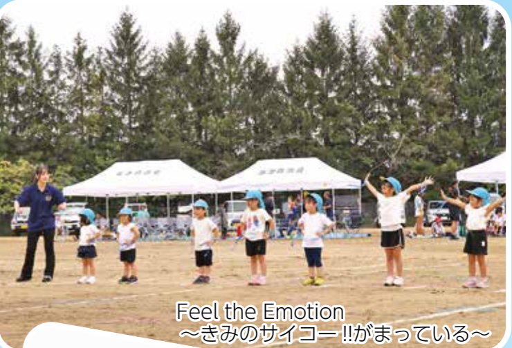
Feel the Emotion ～きみのサイコー!!がまっている～