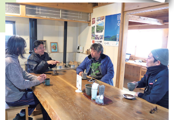
▲くらけんカフェの風景