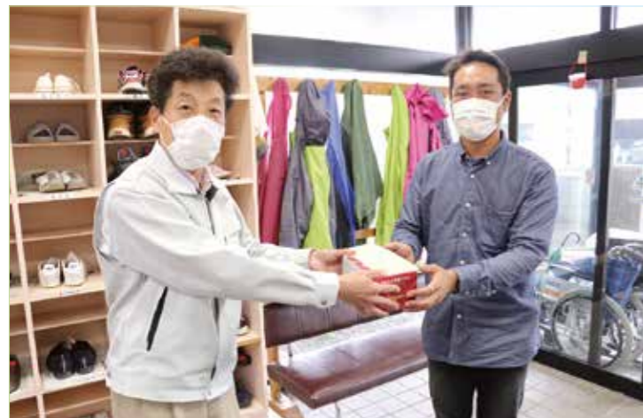
▲福祉施設にマスクを贈呈しました

7月17日、七ヶ宿町商工会青年部から特別養護老人ホームゆりの里七ヶ宿と七ヶ宿町社会福祉協議会へマスクの寄贈を行いました。このマスクは、青年部の地域貢献事業の一環として町民の方々よりご家庭で不要になっているマスクの寄付を募ったもので、不織布、ガーゼ、手作りなど約500枚のマスクが集まりました。寄贈されたマスクは、各施設で感染予防として活用されます。