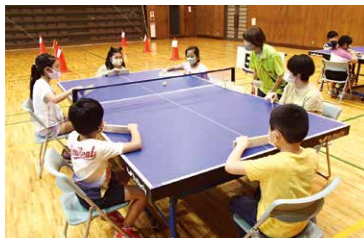
▲卓球バレーをしました

8月4日・5日、活性化センターにて22人の児童を対象に、寺子屋事業を実施しました。2日間を通して、夏休みの宿題や自主学習、七ヶ宿町社会福祉協議会との合同で、石けんづくり体験や、ニュースポーツの卓球バレー、車いす体験を行いました。新型コロナウイルス感染症対策の影響で、事業の規模は縮小されましたが、ジュニア・リーダーとの共同作業もあり、楽しい思い出をつくることができました。