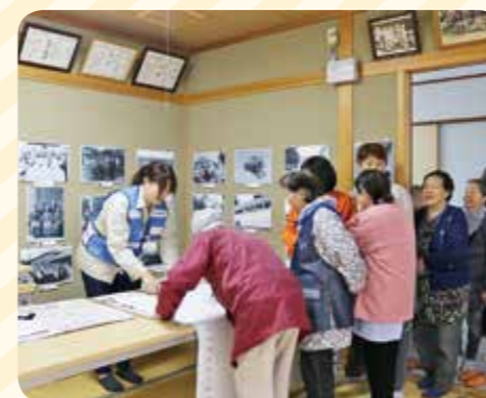
▲避難訓練(避難所開設)