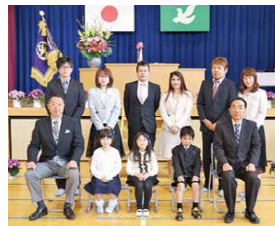
<平成31年度入学式記念写真>

平成31年度の七ヶ宿小学校の教育活動がスタートしました。今年度もどうぞよろしくお願ひいたします。