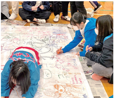
▲キャラコづくりの様子

仙南地域のジュニア・リーダーと交流しました。 12月17日、丸森町で管内ジュニア・リーダー交流研修会が開催されました。七ヶ宿町のぼっぽ組も参加し、開会式では代表の挨拶を務めました。各市町からゲームやダンスを教わったほか、運動会も行い、元気いっぱい体を動かして仲を深めました。自分たちで協力して企画した研修会はとても盛り上がり、大満足で会場を後にしました。