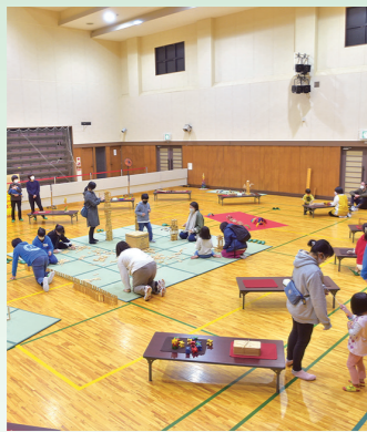
▲たくさんのオモチャで遊びました

11月23日に、活性化センターで「人形劇とオモチャのじかん」を開催し、1歳〜9歳児と、保護者21名が参加しました。人形劇では、人形が繰り広げる楽しいお話に、たくさん笑い声が聞かれました。オモチャで遊ぶワークショップでは、積み木やからくりのオモチャ等を使い、視覚や聴覚だけでなく、バランス感覚や思考に働きかけながら遊ぶことができました。また、保育士による子育てのお悩み相談を受けたほか、ジュニア・リーダーも参加し会場を盛り上げてくれました。