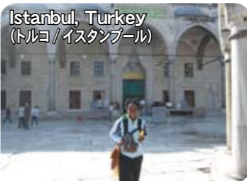
Istanbul, Turkey (トルコ/イスタンブール)