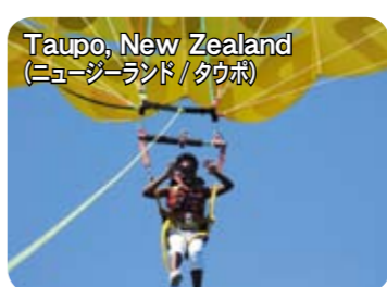
Taupo, New Zealand (ニュージーランド/タウポ)