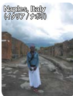
Naples, Italy (イタリア/ナポリ)