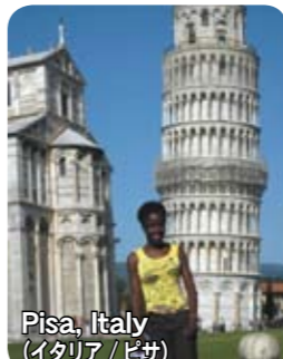
Pisa, Italy (イタリア/ピサ)