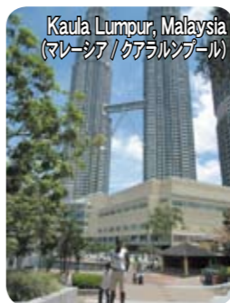
Kuala Lumpur, Malaysia (マレーシア/クアラルンプール)