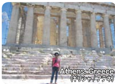
Athens, Greece (ギリシャ/アテネ)

Living in Japan has made me braver. I can now travel to many countries by myself. Thank you Japan! 日本に住んで私は強くなりました。今では一人でいろんな国へ旅行できます。ありがとう日本!!