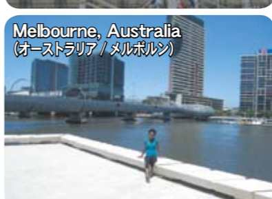
Melbourne, Australia (オーストラリア/メルボルン)