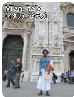
Milan, Italy (イタリア/ミラノ)