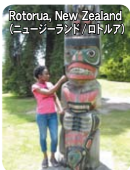
Rotorua, New Zealand (ニュージーランド/ロトルア)