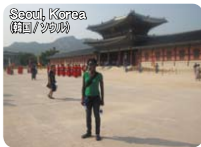
Seoul, Korea (韓国/ソウル)