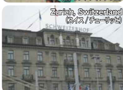
Zurich, Switzerland (スイス/チューリッヒ)