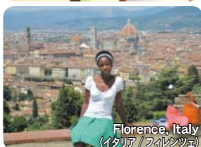
Florence, Italy (イタリア/フィレンツェ)