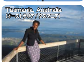
Tasmania, Australia (オーストラリア/タスマニア)