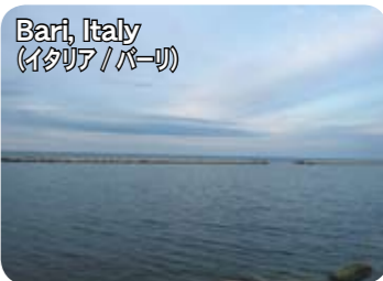
Bari, Italy (イタリア/バーリ)